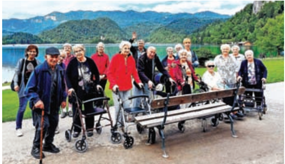
Stanovalci doma na Bledu