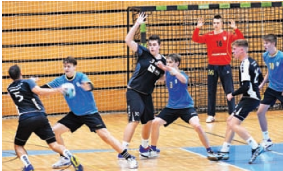
Utrinek s tekme mladincev RK Cerklje – RK Črnomelj

V klubu imamo v prihodnje nove, še višje cilje. Želimo postati športni kolektiv, ki bo v občini Cerklje na Gorenjskem predstavljal novosti v športu, sodobne prijeme, skratka deloval usmerjeno in razvojno ter ne nazadnje igral sodoben rokomet. Tak pristop bomo imeli tako pri stroki, predvsem pri delu z mladimi in najmlajšimi, kot pri organizacijskem vodenju kluba. Trudili se bomo, da bomo