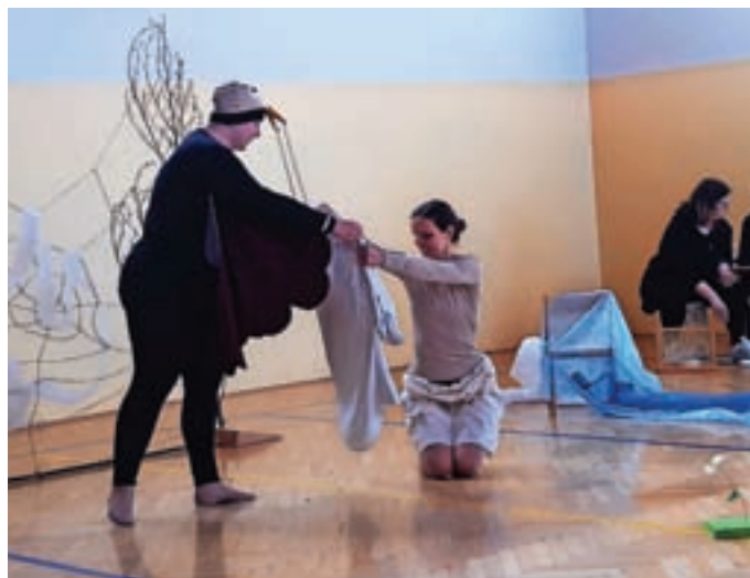
Vzgojiteljice so pripravile tudi dramske igrice za otroke.

V pomladanskem času smo vzgojiteljice pripravile še tretjo predstavo, in sicer pravljico Frana Levstika Kdo je napravil Vidku srajčico. Zadnja predstava je bila bogato glasbeno obar-