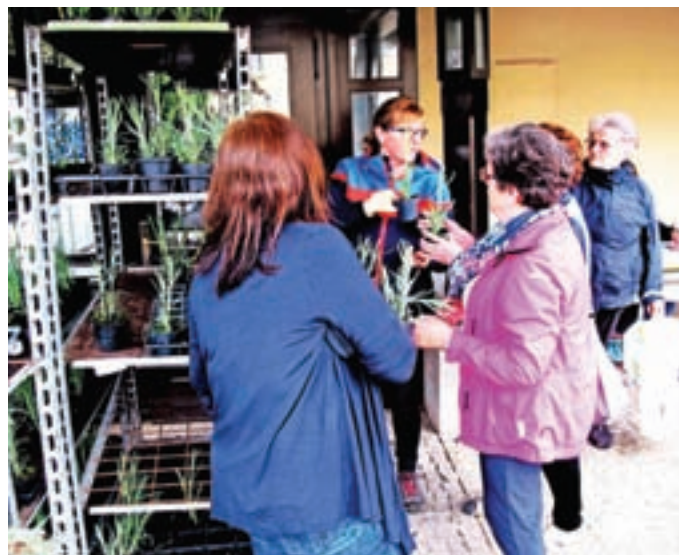
Občani so prejeli brezplačne sadike nageljnov.

V Dvorjah, v bližini gradu Strmol, že več let cvetijo gorenjski nageljni. Nageljni se radi nastavljajo soncu, pravi Albina Atlija, zato so zanje najprimernejša okna in balkon z leseno ograjo na vzhodni strani hiše, kjer so zaščiteni tudi pred dežjem. Goji jih že pet let. Najlepše cvetijo pri dvajsetih stopinjah